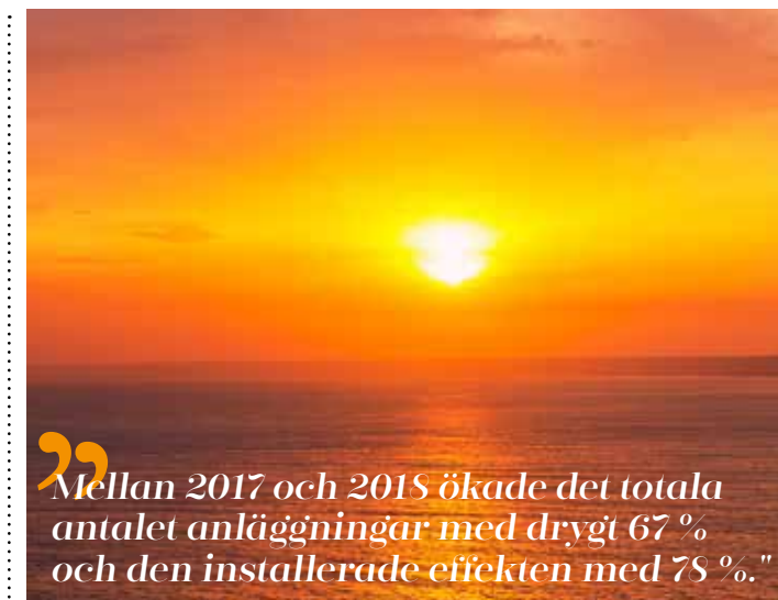
Installerade solcellsanläggningar i Sverige 2016-2018. Antal och installerad effekt (MW)