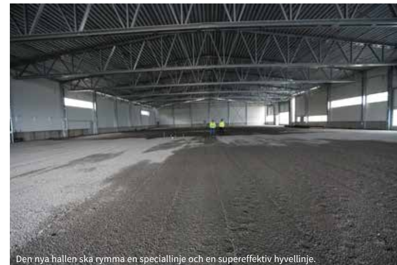
Den nya hallen ska rymma en speciallinje och en supereffektiv hyvellinje.

ur gruslagret som en märklig installation i den tomma hallen. I övrigt får man använda fantasin för att föreställa sig hur det ska se ut. Fredrik och Mikael berättar: I den här delen av byggnaden kommer det att vara två plan. Där nere blir det sliprum och där uppe blir det en inglasad matsal med utsikt över produktionen.