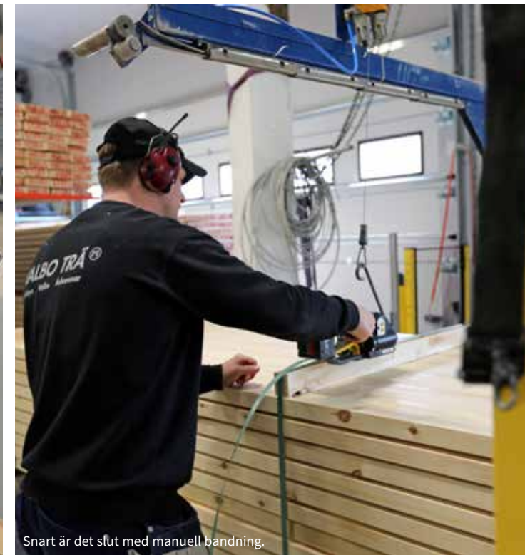
Snart är det slut med manuell bandning.