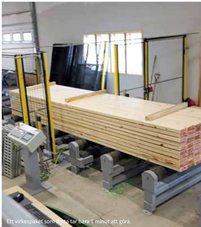
Ett virkespaket som detta tar bara 1 minut att göra.

meter och sekunder. Operatörerna kör, stoppar, justerar i programmet och kör igen. Om och om igen. Det som produceras här just nu är ren bonus.